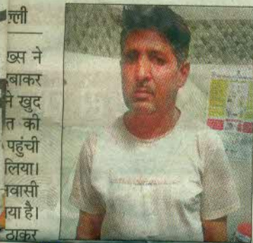
...ली ...स ने ...बाकर ...ने खुद ...त की ...पहुंची ...लिया। ...वासी ...या है। ...कर