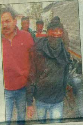
■ आरोपियों में दो नाबालिग भी शामिल